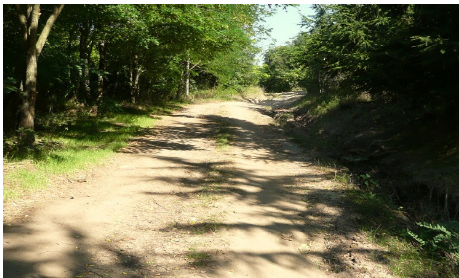
Пътят от асфалта до паркинга за Паша дере

След това автобусът преминава през вилно селище Ракитника и се слиза на последната му спирка – Моста. От там се продължава пеша по същия асфалтов път. След 20 минути ходене има отклонение наляво по асфалтов път за хижа Черноморец. Продължава се направо по асфалтовият път. Пропуска се асфалтово отклонение в ляво, по което се слиза на най-северната част на Паша дере по стръмна дървена стълба (вече я няма). На следващото отклонение пак в ляво по трошено-каменен път, доста лош, се слиза до обширен паркинг.