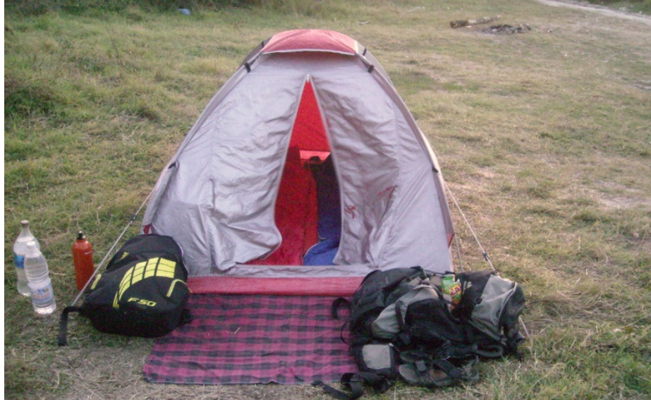
Най-южния край на Б-2 над самото море

В целия участък Б между плажа, гората и блатото има много лош пясъчен път, в който много често закъсват даже джипове.