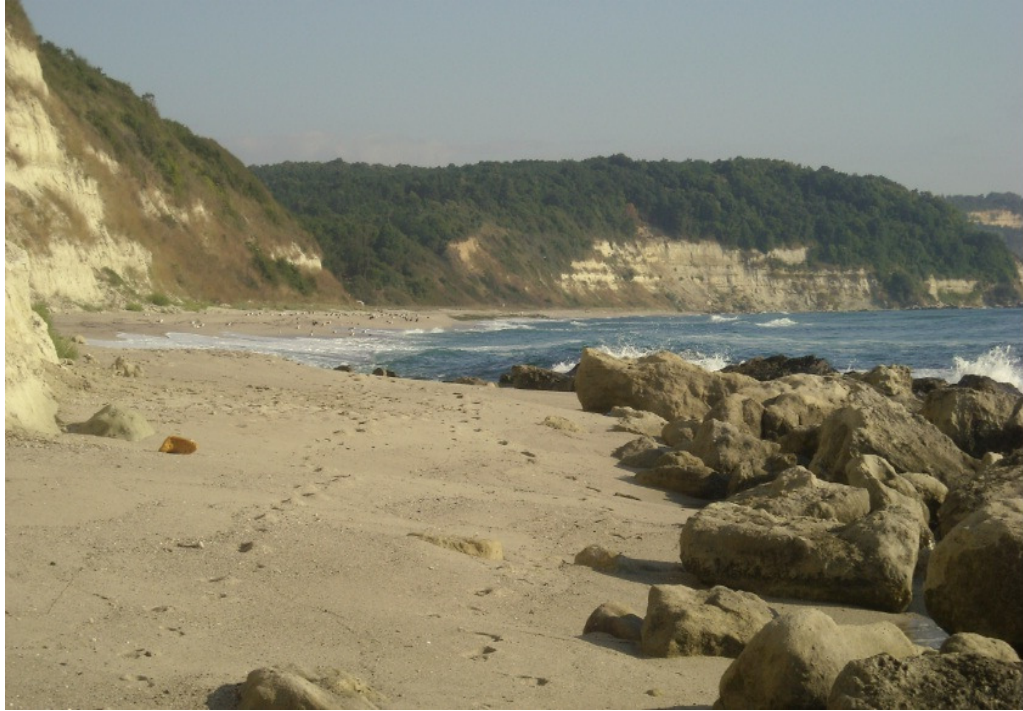
На преден план се вижда участък С, който следобед е в сянка.

http://vbox7.com/play:4279f3e54e на тази връзка може да се види целия залив, като камерата е насочена в началото на север и се върти обратно на часовниковата стрелка.