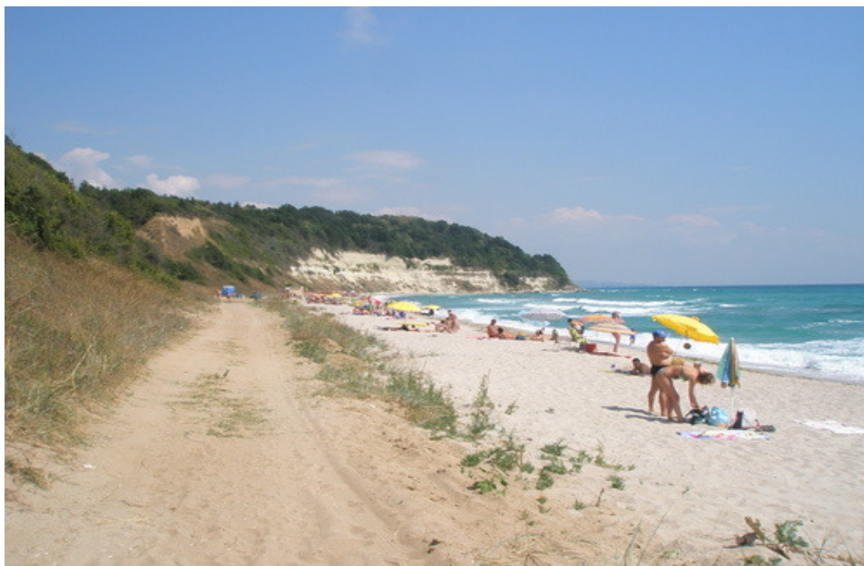
Пътят в участък Б, по който има пропадания опасни и за джипове.

В целия участък Б между плажа, гората и блатото има много лош пясъчен път, в който много често закъсват даже джипове.