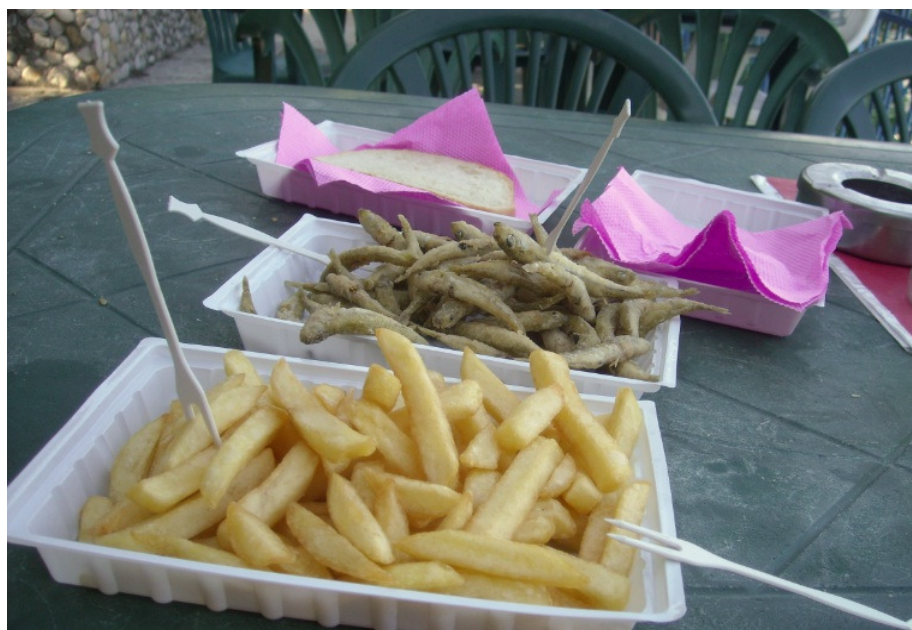
Гюмеш, картофки има и бира!

За да се изкара добре на Паша дере, то всичко, каквото ще е необходимо трябва да се донесе. Вода няма и се мие и къпе в морето. Тоалетната е пак там. На хижа Черноморец (двадесет минути пеша) има заведение, където може да се хапнат местни риби: Гюмеш (дребна бяла цаца), Цаца, Сафрид, пържени картофки и стандартните кебапчета и кюфтета.