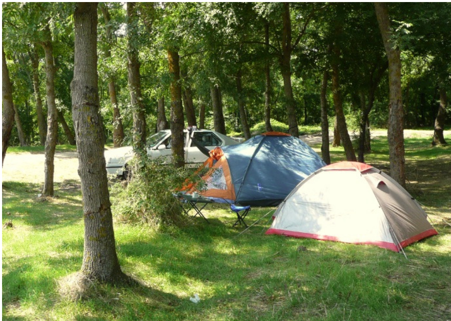
Ето гората над участък Б-1. Виждат се нашите палатки и колата.

В гората някакви са си заградили с телена ограда малък участък и направили нещо като барче със столчета и маси за около 20-30 човека, съблекалня и нужник.