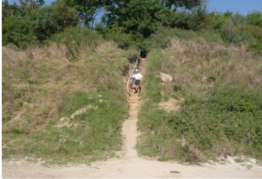
Стълбата към Морето

В гората някакви са си заградили с телена ограда малък участък и направили нещо като барче със столчета и маси за около 20-30 човека, съблекалня и нужник.