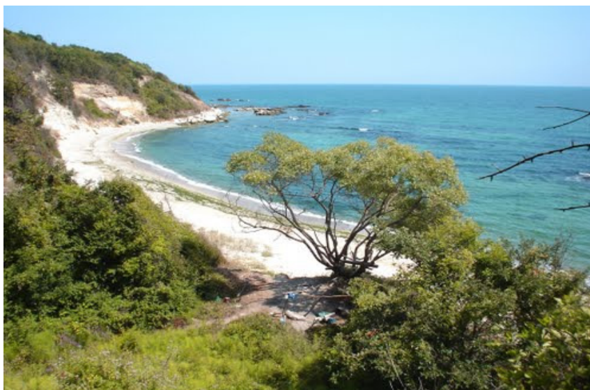
Заливът Света Парина.