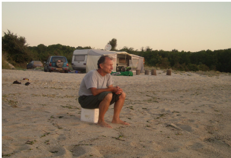
В тази каравана живееше един чудак от Галата, който почти всеки ден пазаруваше с колата си, така че не сме останали гладни!

Продават бял хляб – 20 ст. филийката. От заведението се слиза на плажа, където има сондаж, от който може да се напълни питейна вода. Най-близкият магазин е в Ракитника на около 5 километра от Паша дере.